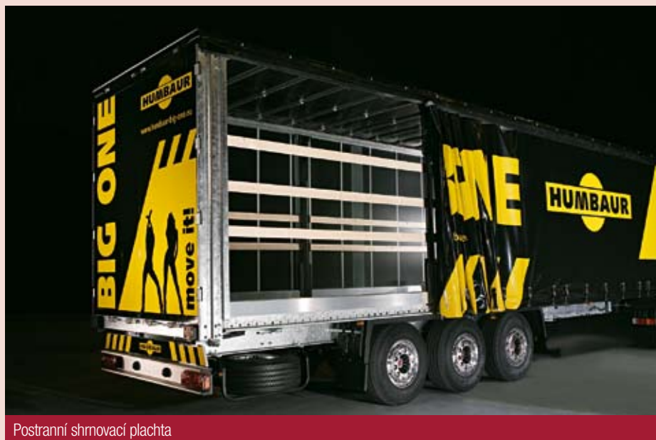
Postranní shrnovací plachta

Výrobní závod v německém Gersthofenu klade důraz především na efektivitu výrobního procesu, vysokou automatizaci výroby a v neposlední