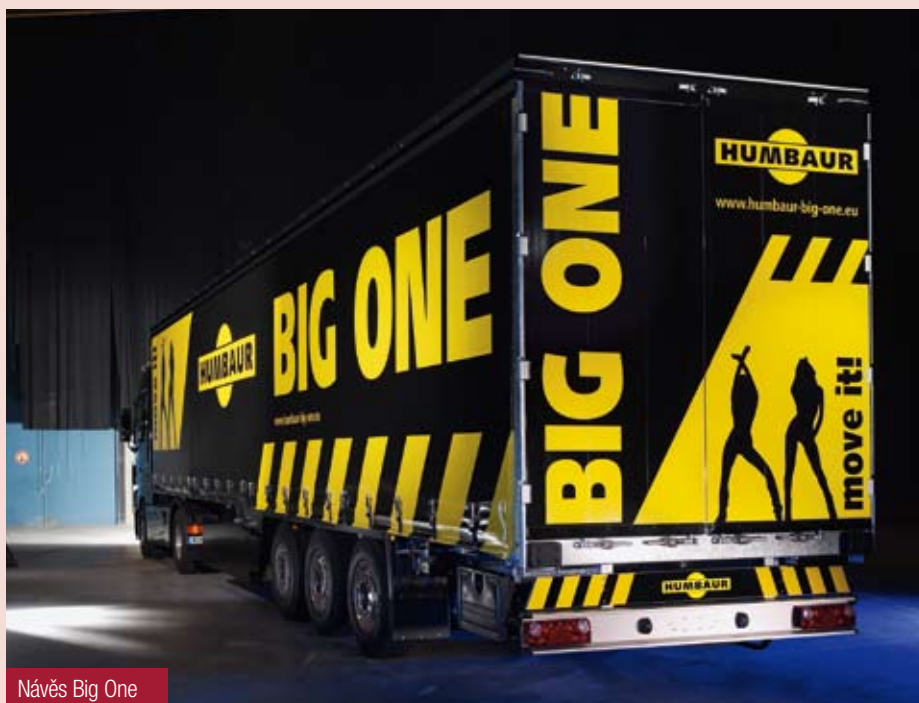
Návěs Big One

V sortimentu plachtových návěsů Humbaur si zákazník může vybrat mezi klasickým návěsem s třístrannou shrnovací plachtou na standardní točnu tahače 1140 mm a na sníženou točnu 1070 mm. Základní vybavení návěsu nabízí pneumaticky odpružené agregáty SAF s kotoučovou brzdou o průměru kotouče 430 mm, zvedací nápravu, elektronickou brzdovou soustavu Wabco, systém EBS kombinovaný s RSS (systém kontroly příčné stability), pětifunkční zadní světla, uzamykatelný držák rezervy a rezervu, pneumatiky značky Continental, schránku na nářadí, hliníkový zadní nárazník a zábrany proti podjetí, hliníkové latě, hliníkové přední dorazové čelo a zadní dvoukřídla vrata, boční posuvné