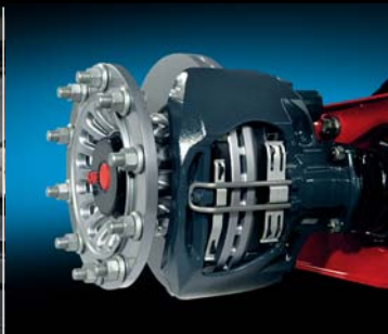
Nápravy SAF Intradisc-plus, průměr kotoučů 430 mm.