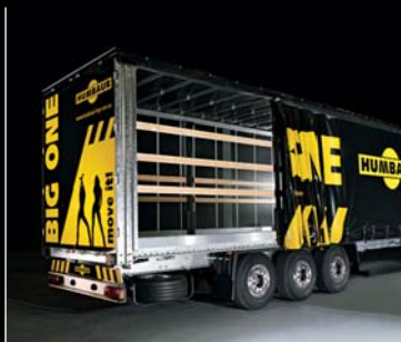
Třístranná shrnovací plachta, posuvné sloupky Hestall.