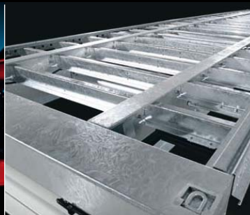
Šroubovaný, žárově zinkovaný rám s velkým počtem příčných nosníků.

Tento text má pouze informační charakter a nelze ho považovat za návrh smlouvy.