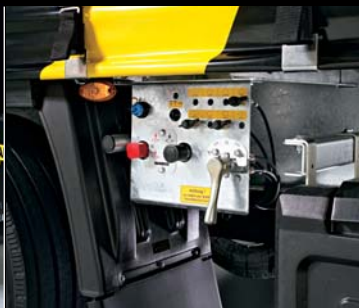
Elektronicky řízená brzdová soustava se systémem (RSS).